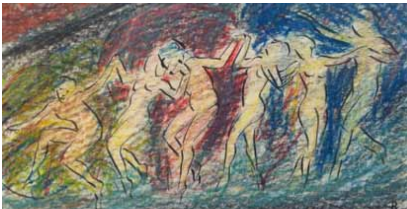
dessin de Rudolf Laban

Ce projet de résidence à l'université de Tours s'articule autour de la pensée de Rudolf Laban 1 .